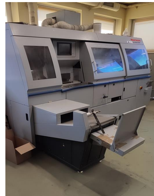
Oklejarka BQ 470 EVA/PUR

Jesteśmy w stałym kontakcie w czasie realizacji zlecenia.