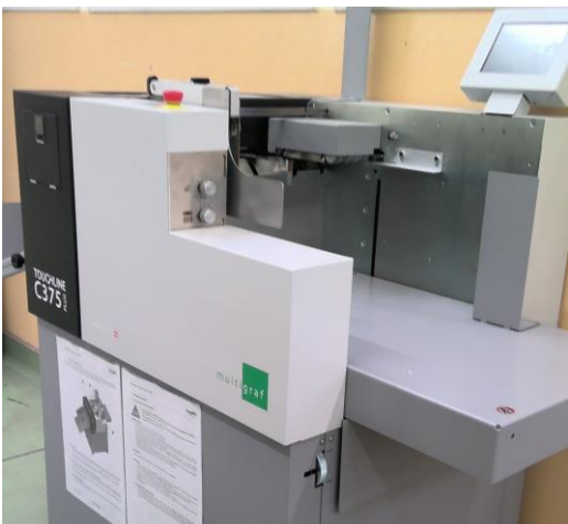
Bigówka TOUCHLINE C375 plus

Zakład Aktywności Zawodowej Fundacji „Nadzieja-Dzieci” był pierwszym tego typu zakładem na terenie województwa śląskiego.