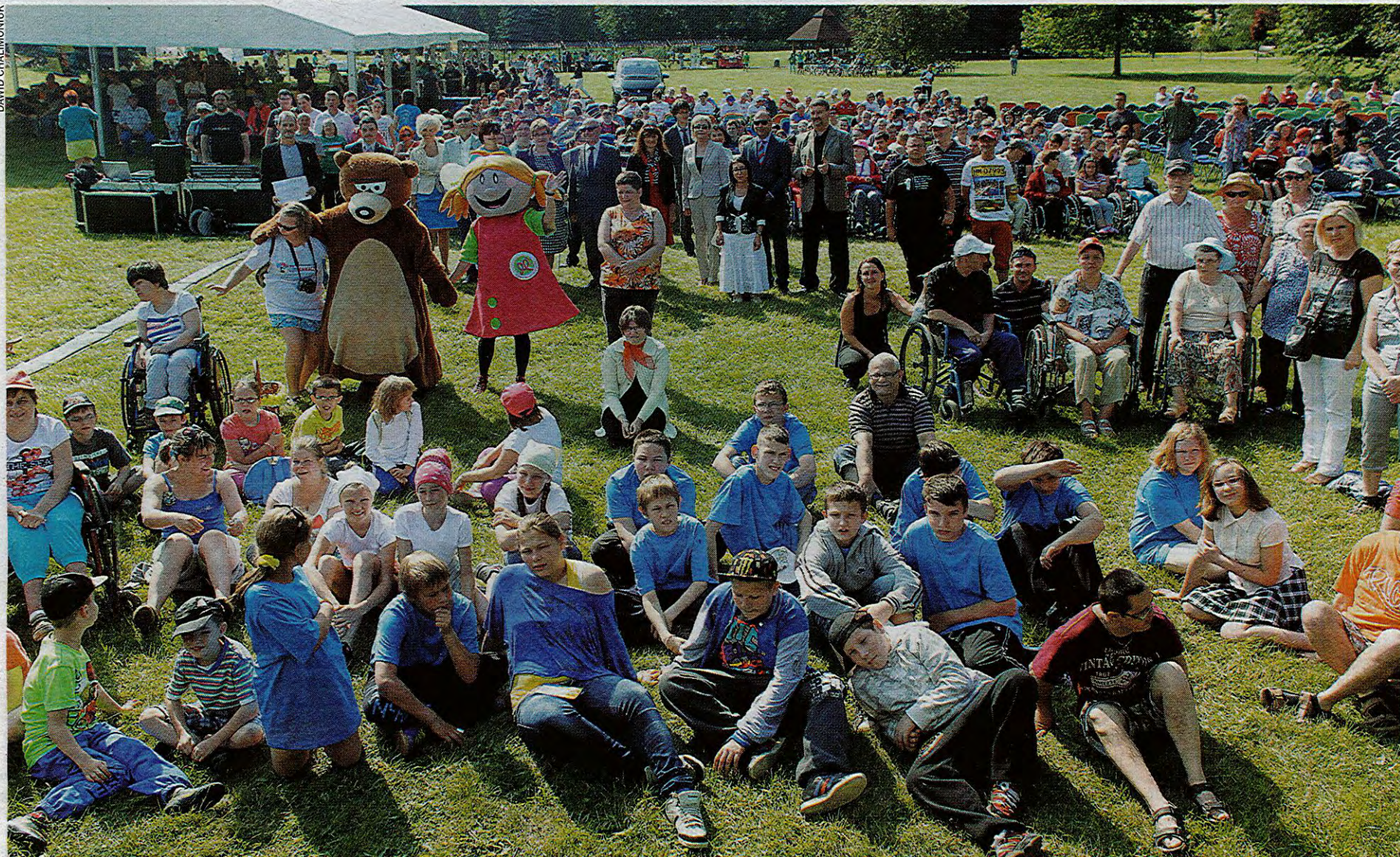
Uczestnicy pikniku w Parku Śląskim