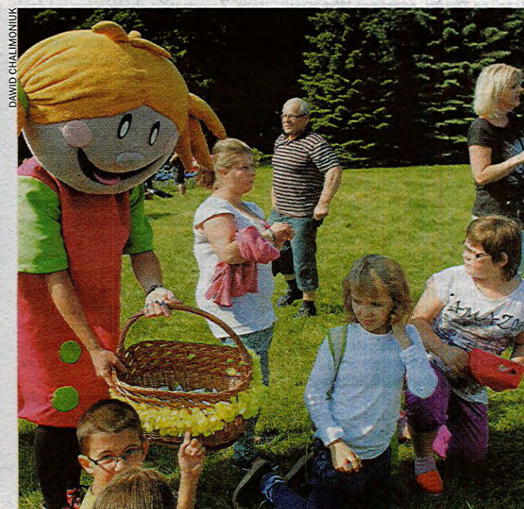
Postaci z bajek pomagają dzieciom