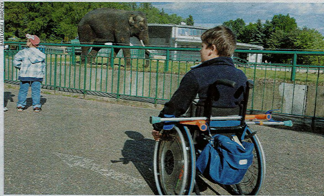
Uczestnicy pikniku mają dostęp do niemal wszystkich atrakcji Parku Śląskiego